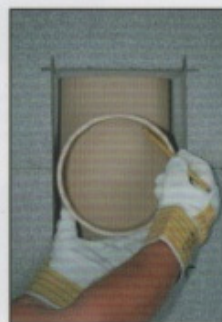
A4. Rauchrohrzarge als Schablone verwenden und entlang des inneren Durchmessers anreißen