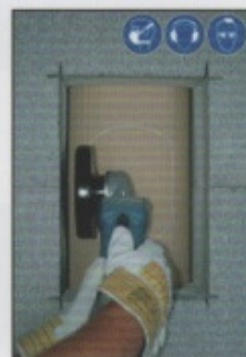
A5. Entlang der Markierung Sollbruchstelle mit Winkelschleifer anschneiden. Seitlich nicht erreichbarer Bereich später bearbeiten (Bild A8. und A9.)