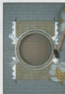
A15. Putzring zentrisch annageln