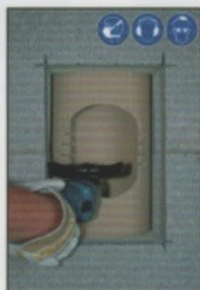
A8. Verbliebene seitliche Profilrohrsegmente streifenförmig einschneiden. Streifenbreite ca. 10–15 mm