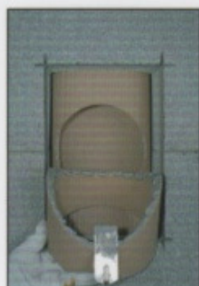
A11. Nach Reinigen beider Kittflächen Schiedel-Fugenkitt auf die Rauchrohrzarge auftragen