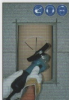
A6. Das Profilrohr sternförmig mit Winkelschleifer einschneiden