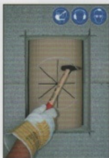
A7. Profilrohrteile vorsichtig mit Hammer entfernen