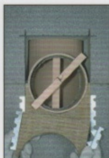
A13. Frontplatte zuschneiden, Haltewinkel aufstecken und Frontplatte einsetzen