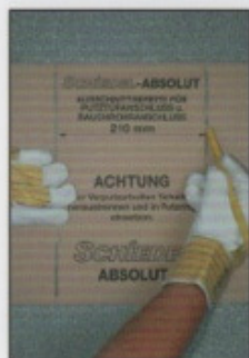
A1. Unter Verwendung der Schnittschablone Mantelsteinöffnung anreißen