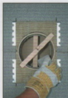
A14. Kittreste vorsichtig mit Schwamm entfernen