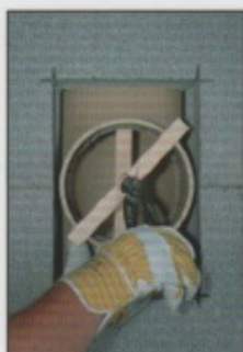
A12. Rauchrohrzarge am Profilrohr feströdeln