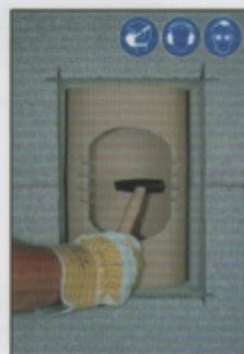
A9. Restliche Profilrohrteile vorsichtig mit Hammer entfernen