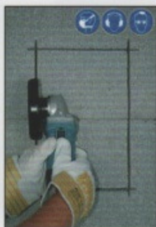
A2. Mantelstein mit Winkelschleifer an den Markierungslinien aufschneiden