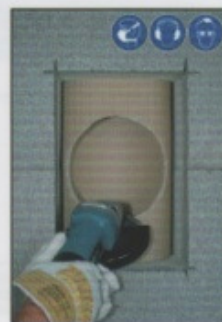
A10. Unebenheiten an der Sollbruchstelle mit Winkelschleifer nacharbeiten